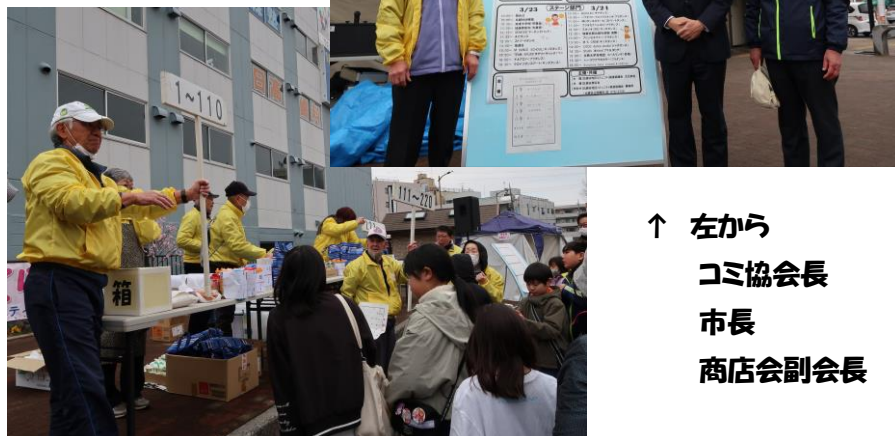
↑ 左から コミ協会長 市長 商店会副会長