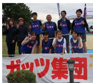
地区対抗リレー 決勝7位

11月2日(日)に開催されたファミリースポーツデイの結果をまとめて発表！ リレーは2年連続決勝進出！その他の種目も、“ガッツ集団北越谷”の名にふさわしい活躍でした！