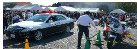
【パトカー・白バイの展示】