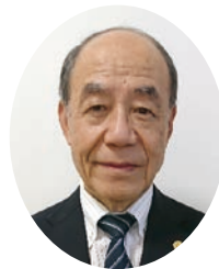
南越谷地区自治会連合会