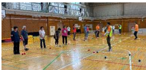
【ボッチャ体験教室の様子】