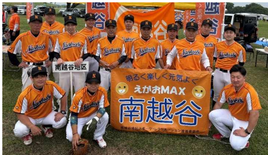
【南越谷地区代表選手のみなさん】

6月7日(日)、江戸川広域運動公園グラウンドにて第71回市民体育祭地区対抗ソフトボール大会が開催されました。南越谷地区からは男子チームが出場し、一回戦で北越谷地区と対戦しましたが、惜しくも敗退となってしまいました。2年ぶりの開催となった本大会は、選手をはじめ、スポレク関係者、応援に駆けつけた地域の皆様など、多くの関係者で大いに盛り上がりました。南越谷地区の選手の皆様、スポレク関係者の皆様、大変おつかれさまでした！