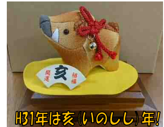
H31年は亥（いのしし）年!