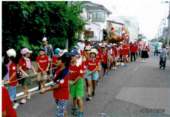
子ども山車の様子