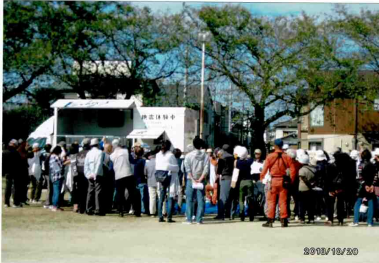
自主防災訓練の様子