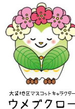
大袋地区マスコットキャラクター ウメブクロ