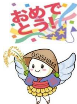
荻島地区コミ協マスコットキャラクター 「いなぽっぽ」