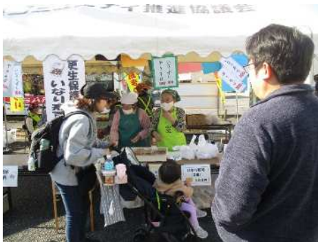
子ど もゲー ムコー ナー