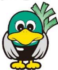
越谷特別市民 ガーヤちゃん