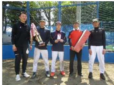
優勝 さしきだ自治会