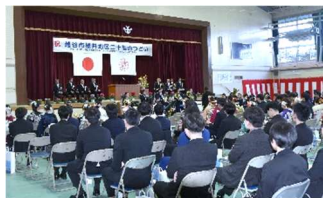
【典 の 様 】