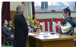
【誓 詞 】