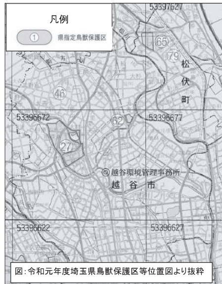
越谷市における鳥獣保護区

埼玉県指定鳥獣保護区として、市内では2箇所が指定されています。鳥獣保護区とは、多様な鳥獣の生息環境を保全、管理及び整備することにより、鳥獣の保護繁殖を図ることを目的として、指定されたものであり、狩猟による鳥獣の捕獲等が禁止されています。また、越谷市全域が特定猟具使用禁止区域(銃)として指定されており、銃猟が禁止されています。