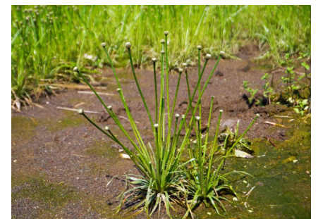
■コシガヤホシクサ

自然環境を活用したグリーンインフラの整備・改善に向けた取組を進めるため、農地利用集積による優良農地の保全や農地の多面的機能への理解促進に取り組みます。