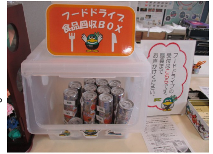
■フードドライブ※1のための食品回収ボックス

今後の少子高齢化の進行など長期展望に基づく収集・処理システムの検討や、超高齢社会に対応したふれあい収集の継続及び将来を見据えた対策強化の検討、使用済み紙おむつ対策の検討を進めます。