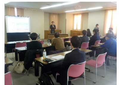
■SDGsパートナー交流会

市民の消費行動の変化を促進させるため、環境や社会に配慮された製品やサービスを購入する「エシカル消費※1」の普及啓発を行います。また、プラスチックごみ発生抑制や食品ロス削減、地産地消推進などの活動を推進します。