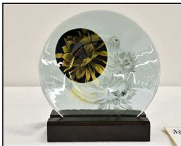
第23回市展 工芸部門 市長賞 「月来香」

駐車料金 1時間無料、 1時間以降30分毎100円 (台数に限りがありますので、 できるだけ公共交通機関をご利用ください。)