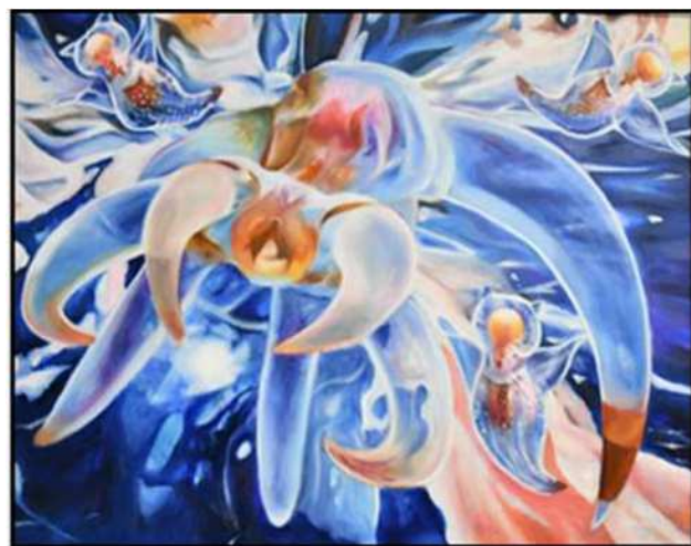
第23回市展 洋画部門 高校生特別賞 「二面性のインペダー」