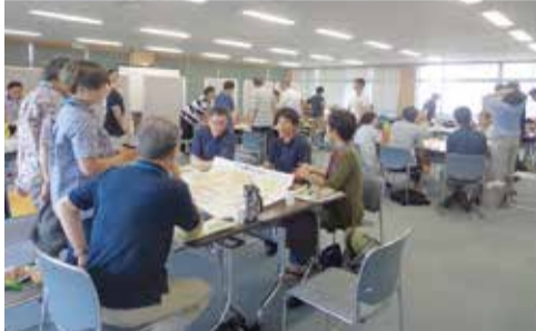
市の将来像などについて意見交換を行いました(市民懇談会)

発行/越谷市 ☎343-8501 埼玉県越谷市越ヶ谷4-2-1 ☎048-964-2111(代表) ☎048-965-6433 http://www.city.koshigaya.saitama.jp/ *広報紙は市ホームページからもご覧になれます 編集/広報広聴課