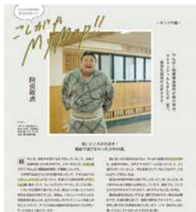
こしがやの未来を創る魅力宣伝大使の阿炎関などもスポットを紹介

〈冊子配布場所〉 東武スカイツリーライン北千住駅・新越谷駅・北越谷駅、東武東上線池袋駅、観光課 〈動画放映場所〉 東武日光線南栗橋駅・東京メトロ日比谷線中目黒駅のトレインビジョン、イオンレイクタウンkazeのデジタルサイネージ、市ホームページ *詳しくは市ホームページをご覧ください。下記の二次元コードからもアクセス