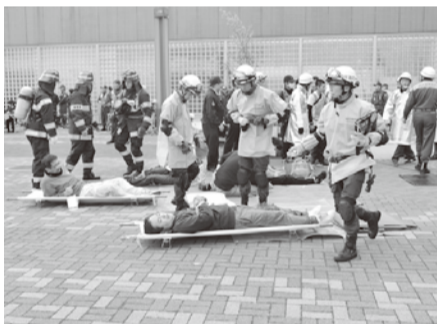
爆弾テロを想定した訓練です

【爆弾テロ災害活動訓練】 陽2月6日(木)、午前10時から 陽東武スカイツリーライン北越谷駅前広場 陽北越谷駅西口バス停留所で爆弾テロ災害が発生し、負傷者が多数いるとの想定で、情報収集、避難誘導、救出救助、救急処置等の訓練を行います。 陽消防署 ☎974-1101