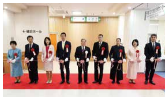
竣工式典でのテープカットの様子

2月16日、東越谷に新たに完成した保健センターで竣工式典が行われました。 式典では、保健センターの整備事業に対する寄付をいただいた越谷市医師会、越谷市歯科医師会、越谷市薬剤師会へ感謝状の贈呈などを行いました。 5(3月31日)まで