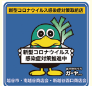
越谷特別市民のガーヤちゃんが目印

本市では9月1日(火)から、南越谷商店会・新越谷西口商店会および接待を伴う飲食店関係者と連携し、新越谷・南越谷駅周辺エリアにおいて新型コロナウイルス感染症対策を推進している事業所(店舗・施設等)を対象に「新型コロナウイルス感染症対策推進宣言ステッカー」を配布することとしました。これは、新越谷・南越谷駅周辺エリアの事業所が感染症対策に率先して取り組むことをお願いするとともに、利用する皆さんに感染症対策を推進している事業所を分かりやすくお伝えするためのものです。詳しくは、市ホームページをご覧ください。