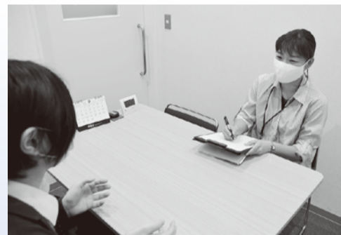
個室でご相談を伺いますので安心してお越しください

また、講師に専門家や当事者を招いた講演会「家族教室」を例年開催しています。ほかにも、悩みを抱えた家族が話し合いや勉強会をする「家族の集い」、当事者が気軽に参加できる「居場所」を令和元年度(2019年度)から定期開催しています。これまで新型コロナウイルス感染症の拡大を防止するため、一部で開催を延期していましたが、今後は感染防止対策を徹底し順次開催していきます。開催予定など、詳しくは市ホームページや広報しがやお知らせ版でお知らせします。