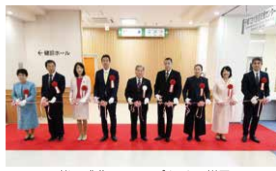
竣工式典でのテープカットの様子

2月16日、東越谷に新たに完成した保健センターで竣工式典が行われました。 式典では、保健センターの整備事業に対する寄付をいただいた越谷市医師会、越谷市歯科医師会、越谷市薬剤師会へ感謝状の贈呈などを行いました。 5(3月31日)まで