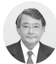
越谷市医師会 会長

高齢者や基礎疾患のある方の中には、肺炎や呼吸不全となり亡くなることもあります。医師会では、昨年4月より医療機関からの紹介によるPCR検査センターを立ち上げ、多くの方を早期診断できるようにいたしました。完全防護服を着用して医師会員が実施しております。中核市である越谷市では、医師会と保健所との連携が大変良く出来ており、保健所から依頼のクラスター対策のPCR検査も実施しております。万一、陽性になった場合は、保健所の管理下となり症状に合わせて治療を受けることとなります。新型コロナの初期症状では、インフルエンザとほとんど区別できません。そこで、発熱患者をなるべく出