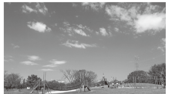
公園第9-2号「県民健康福祉村(広場)」 問都市計画課(新本庁舎6階) ☎963-9221、mailto:shikei@city.koshigaya.lg.jp

■内容：「心が和らぐこしがやの景観」をテーマに、市内の好きな場所、大切にしたい景観を募集。テーマ以外の景観も応募できます。応募された景観は、審査を経て「こしがや景観資源」として登録し、市ホームページで公表 ■応募書類：応募用紙、写真 ■申込み：7月31日(土)まで(消印有効)に、応募書類を直接または郵送、メールで都市計画課へ(土曜・日曜日、祝日を除く)。応募用紙は下記で配布するほか、市ホームページから印刷できます。提出物は返却しません