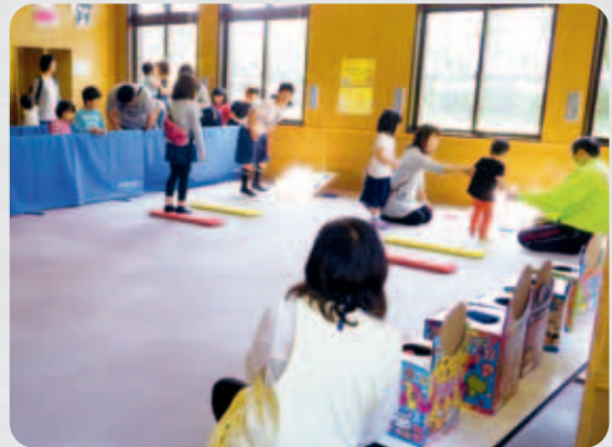
こどもの日フェスティバル