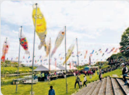
不動橋こいのぼりフェスティバル