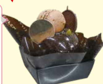
ビズショコラ 400円(税込み)