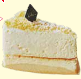
2層のチーズケーキ 432円(税込み)