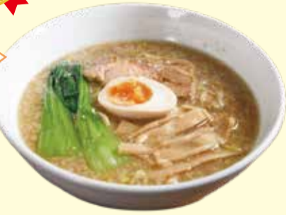
天狗ラーメン(しょうゆ) 660円(税込み)