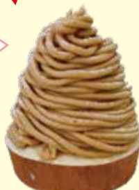
モンブラン 459円(税込み)