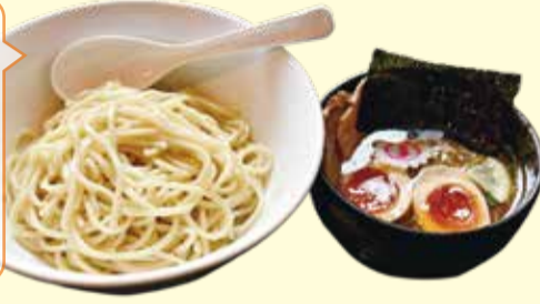
特製つけ麺 1,050円(税込み)