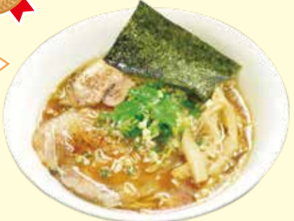
醤油中華そば 800円(税込み)