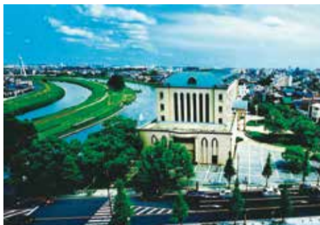
視点場第7号「越谷市役所本庁舎からの眺め」

「あなたにとってイチオシの視点場」をテーマに、市内の好きな場所、大切にしたい景観を募集しています(視点場とは遠くまで見ることができる場所のことです)。募集締め切り後、審査を経て「こしがや景観資源」として登録・公表し、景観の保全・活用に努めます。