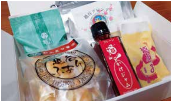
こしがや愛されグルメ詰め合わせセット

国民健康保険税の口座振替を新規で申し込みした方の中から抽せんで、こしがや愛されグルメ詰め合わせセットをプレゼントします。