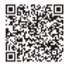
スマートフォンでかんたん納税