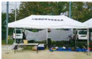
ワンタッチテント

越谷市川柳地区自治会連合会では、(一財)自治総合センターの令和3年度宝くじ助成を受けて、ワイヤレスアンプ、プロジェクター、ノートパソコン、ワンタッチテント、折り畳み机等の自治会活動に必要な備品を整備しました。