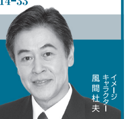
イメージ 風間 社長 夫

※調査企画：日本マーケティングリサーチ機構 調査概要：2020年10月期 ブランド名のイメージ調査