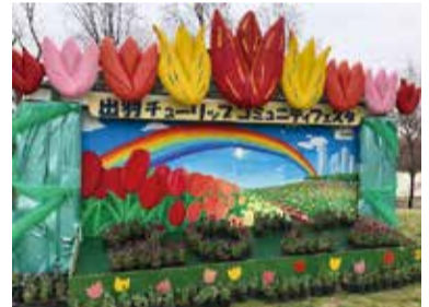
昨年度開催時の様子