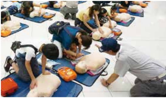
心肺蘇生法を学ぶ様子