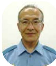
越谷警察署 赤星 誠 署長

越谷警察署管内の特殊詐欺 被害は、認知件数48件、被害 総額1億7,081万円(5月末)。埼 玉県下ワースト1位。認知件数 は、2位の警察署のほぼ2倍！ たとえば、一層危機感が伝わ ると思います。