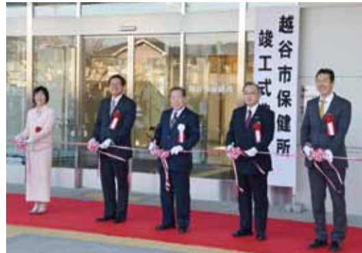
▲テープカットの様子