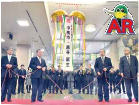
市役所1階ロビーで行われた移行式

投票者数9万2544人、投票率は34・89%でした。 また、越谷市議会議員一般選挙では、有権者数26万5206人、投票者数10万3395人、投票率は38・99%でした。 開選管理委員会 ☎9633119276