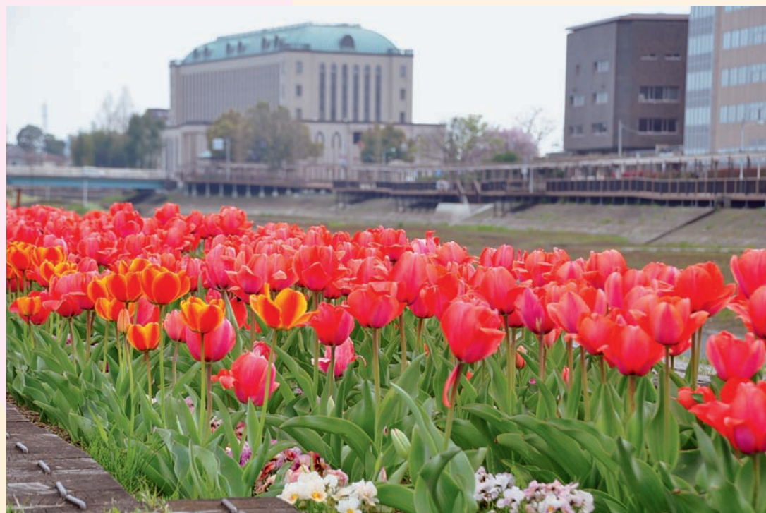
市役所脇葛西用水に咲くチューリップ

日ごとに暖かさが増し、春の訪れを感じられるようになってきました。間もなく、市内では桜やチューリップなどさまざまな花が開花し、訪れる人々の目を楽しませてくれるようになります。市内には、季節の花が美しく咲き誇る河岸、木々が生い茂る緑道、歴史を感じられる街並みなどがあります。今号では市内に詳しい4人の方から、これからの時期に出かけるのにぴったりな場所を紹介していただきます。天気の良い日に、市内を散策してみませんか。