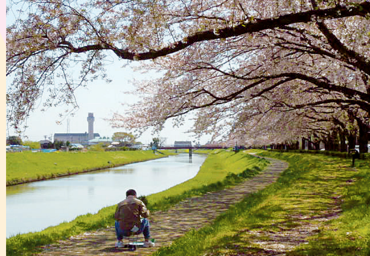
地域の人の散歩コースとしても親しまれている新方川緑道

私がおすすめします! 私たちが観光ボランティアガイドは、季節に合わせて市内のさまざまな場所を巡るご案内をしています。 今回ご紹介するコースは、春の花を楽しみながら半日ほど回れるコースです。気軽なハイキング気分、家族や友人とおしゃべりしつつ、ゆっくりウォーキングを楽しんでください。