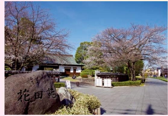
花田苑の入口も見どころの1つ