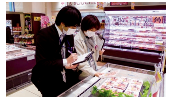
スーパーでの監視指導の様子