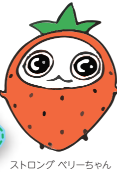
ストロング ベリーちゃん