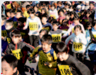
元旦マラソン大会