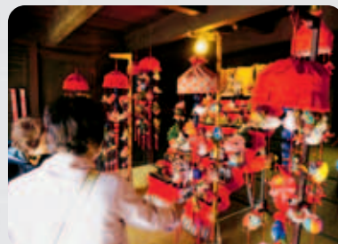
越ヶ谷宿の雛めぐり