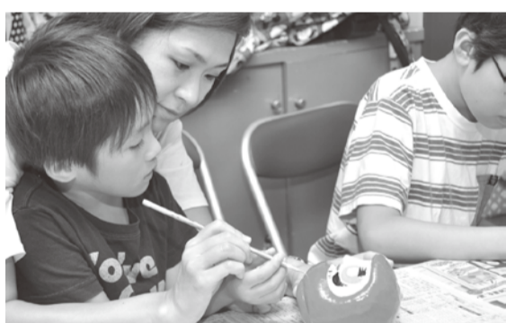
オリジナルだるま、完成まであと少し

8月24日、児童館コスモスで夏休みチャレンジ体験「だるまの顔描き」が開催されました。これは、越谷市伝統的手工芸品振興協議