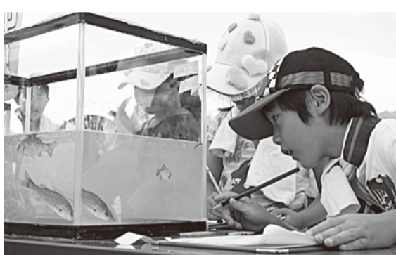
真剣な表情で魚を観察していました

8月7日、弥栄小学校脇の新方川で、「水辺の楽校」〜新方川の魚を調べてみよう!〜が行われました。この催しは、新方川の生物