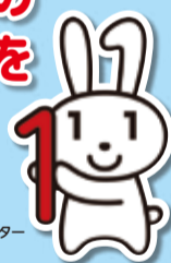
マイナンバー マスコットキャラクター マイナちゃん

① 申請書を郵送 マイナンバーカードは、顔写真付きの本人確認書類です。マイナンバーカードを作ることで、市役所や出張所に出向くことなく、全国のコンビニエンスストア等で住民票の写しや印鑑登録証明書などの証明書を受け取れるコンビニ交付を利用することができます。マイナンバーカード交付までの流れは次のとおりです。