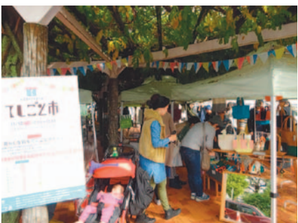
さまざまなお店が出店します

11月20日(日)12月4日(日)午前10時～午後3時 園花田苑 園各日80人 園500円(別途入園料100円) 11月27日(日)午前10時～午後3時 園花田苑 園80人 園300円(別途入園料100円) 11月13日(日)午前10時～午後3時 園中央市民会館劇場 園小・中学生の詩や作文の優秀作品表彰と発表 園無料 11月12日(日)午後1時30分～3時 園中央市民会館劇場 園小・中学生の詩や作文の優秀作品表彰と発表 園無料 11月12日(日)午後1時30分～3時 園中央市民会館劇場 園小・中学生の詩や作文の優秀作品表彰と発表 園無料