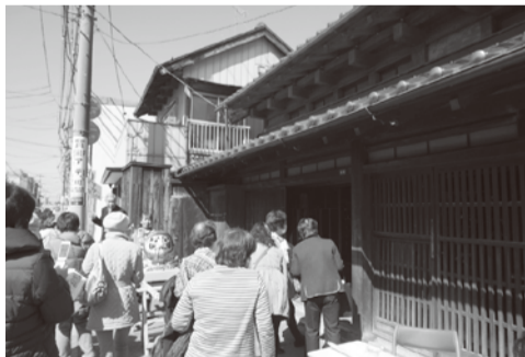
雛めぐりなどに行われるガイドツアーも大人気

11月13日(日)開催の「日光街道越ヶ谷宿 第4回宿場まつり」については8面を見てね！