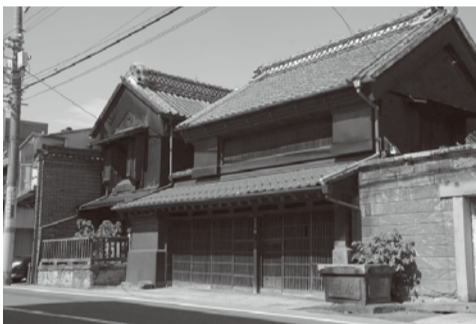
当時の様子がわかる建物が並ぶ

コバトちゃん そっか、越ヶ谷にある宿場町だから越ヶ谷宿なんだ！ 古いおうちがあるなあって思っていたけれど、そんなに昔からあったのね。 コブちゃん 越ヶ谷は3番目だけれど、1番目と2番目はどこなの？ キク姉さん 日本橋を出発して、最初が千住、その次が草加ね。日光に着くまでに全部で21の宿場町があったそうよ。 コバトちゃん そんなにたくさん！