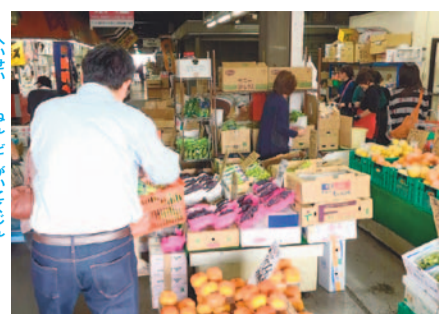
朝早くから多くの来場者でにぎわいます

平成29年1月8日(日)、午後1時30分開演 関サンシティ大ホール 無料。入場には指定席券が必要です。当日午前11時からホール入口で指定席券を配布します。1人2枚まで。満席