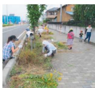
地域の方も参加して、除草作業を行っています

「NPO法人 大道・屋敷林の会」は、かつての屋敷林の続く道や風景を住民自らの手で創出し、故郷として誇りを持っての街並みを次世代に引き継いでいくことを目的に活動しています。