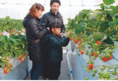
甘くておいしいイチゴを食べよう

開園3年目を迎える越谷いちごタウンが、平成29年1月3日(火)にオープンします。また、市内には四季を通して果物狩りができる観光農園があります。詳しくは、公共施設等にある「こしがや観光農園マップ」または市ホームページをご覧ください。上記の二次元コードからもご覧になります。さらに、今シーズンから、インターネット予約システムを導入します。