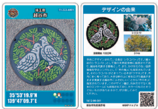
カード(表) カード(裏) 関下水道課☎963-9206

全国各地の特色あるマンホールのふたを紹介するカードです。越谷市のマンホールカードを次のとおり配布します。《配布開始日》12月1日(木)から 《配布時間》午前10時～午後7時 《配布場所》越谷市物産展示場(越谷駅東口高架下) 《枚数》2,000枚 《費用》無料(1人1枚まで) *越谷市物産展示場は水曜日が休みです。水曜日が祝日の場合はその翌日が休みです