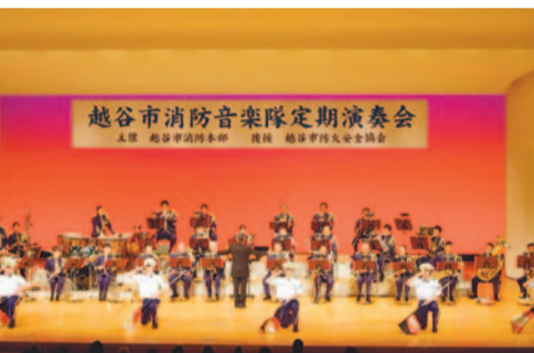
毎回満席となる人気の演奏会です

平成29年2月5日(日)、午前8時30分開会(8時～8時20分受付) 関総合体育館 関各種目2重とび、親子とび、時間とび、長なわとび、部門：小学1年～6年生、中学生、一般(男女別と親)、親子とび(小学1年～2年生と親)、長なわとび