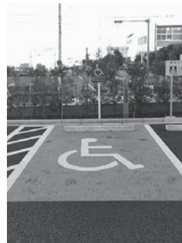
車いす使用者用駐車場