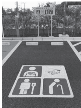
おもいやり駐車場

また、年度末にかけて、駐車場が大変混雑しますので、時間に余裕をもって来庁されるか、公共交通機関のご利用をお願いします。