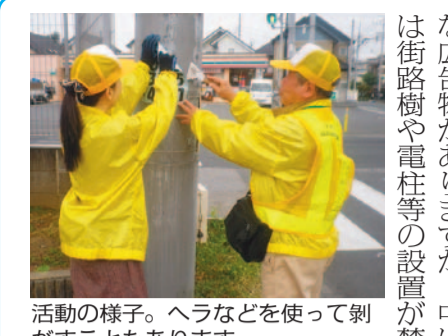
活動の様子。ヘラなどを使って剥がすこともあります

止されている公共物に取り付けられた違反広告物もありません。そうした違反広告物の除去活動を行っているのが、越谷市違反広告物簡易除去推進員です。