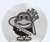
記念品: ガーヤちゃんの交通安全ステッカー