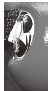
横(よこ)から見ると鼻(はな)の高さ(たかさ)が分(わ)かります

と、機械(きがい)を使って真空成型(くわくくわくせいせい)で作るものがあるわ。その後は、胡粉(こ)と呼ばれる塗料(ぬり)で下塗り(したぬり)してから、色を塗(ぬ)って顔(かほ)や文字(あざな)を描く(か)のよ。