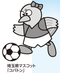
埼玉県マスコット コバトン

▼宮本サッカースポーツ少年団 毎週土曜日・日曜日、祝日。 小学校低学年：午前9時~11時、小学校高学年：午前11時~午後1時 陽宮本小学校庭 入会金2000円、月会費1500円 岡鈴木 ☎090-8550333-15 ▼大相模サッカースポーツ少年団 毎週土曜日・日曜日、祝日。 幼児(年中・年長)、小学1~2年生：午前9時~11時、3~4年生：午前11時~午後1時、5~6年生：午後1時~3時30分 陽大相模小第2校庭 月会費は幼児(年中・年長)1000円、小学生2000円 岡佐々木 ☎080-5502117-824 ▼越谷PCキッカーズスポーツ少年団 毎週土曜日・日曜日、祝日、午後9時~11時、祝日、午後1時~3時 陽大相模中テニスコート 月会費は小学1年~6年生 陽