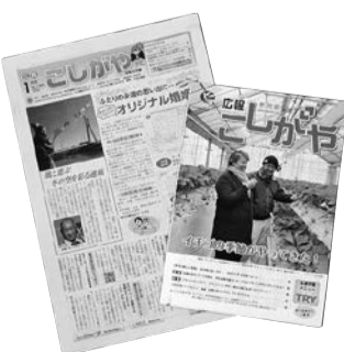
発行部数は毎号12万部以上!

〈発行部数・掲載号〉 △お知らせ版(毎月1日発行。12万8000部)：5月号〜平成30年4月号 △季刊版(3・6・9・12月の15日に発行。12万4000部)：夏号(6月)、秋号(9月)、冬号(12月)、春号(3月)。いずれも、発行部数は年度途中で変更することがあります 〈規格・掲載料・募集数〉 △お知らせ版：1区画(縦4・6センチ×横7・8センチ)につき、2色面は1万円、カラー面は3万円。1号につき2色面12区画、カラー面3区画 △季刊版：1区画(縦5・5センチ×横9センチ)につき3万円。1号につきカラー面12区画(すべてカラー面) 〈申込み〉 △お知らせ版：3月10日(金)まで(1回の申込みにつき最大6号分まで) △季刊版：3月31日(金)まで。