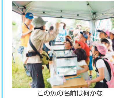
この魚の名前は何か

◆ NPO法人 越谷ふるさとプロジェクト プロジェクト 越谷ふるさとプロジェクトは、自然の価値を体感してもらい環境意識を高め、地域の環境保全活動を支援できる人材と一緒に学び育むことを目的に、平成19年に立ち上がった団体です。現在、会員は16人。そのうち半数は教育に携わったメンバーによって構成されています。主な活動は、イオンレイクタウンで定期的に開催する子ども向けの自然や科学を体験するイベントの運営や、行政と協力しての自然体験・野外活動プログラムの展開など。昨年8月には、越谷市環境政策課と連携し、市内を流れる荒川源流を訪ねる環境学習ツアーを実施しました。また、地域の学生とのコラボレーション企画にも力を入れており、文教大学に通う学生のボランティア登録者は80人にのぼります。