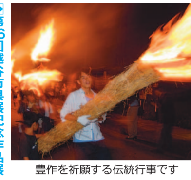
豊作を祈願する伝統行事です

文化財継承事業 「北川崎の虫追い」に自分で作った松明を持って参加しませんか ①松明作り・講習会：7月9日(予備日7月16日)、午前8時30分～11時 ②虫追い：7月24日(月)、午後6時～8時 ③北川崎集会所(北川崎1-7) 市内在住のおおむね小学3年生以上のお子さんと保護者等15組、一般の方10人 無料(飲み物、タオル、軍手、帽子、カメラ(必要なら))。服装は長袖・長ズボン。6月11日(日)、午前10時から直接または電話で左記へ。市ホームページから電子申請でも申し込みできます。 問 新方地区センター ☎971-0800