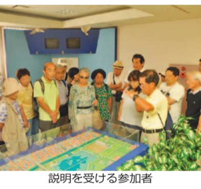
説明を受ける参加者