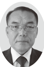
副議長 高橋 幸一氏