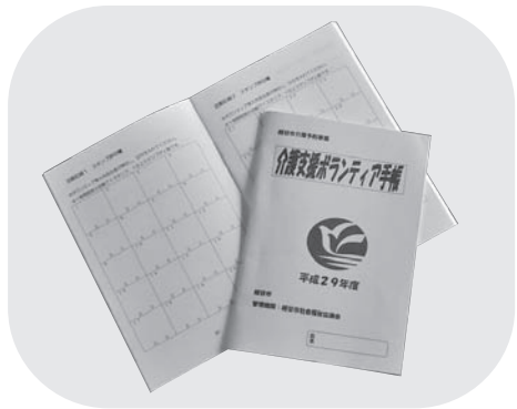
介護支援ボランティア手帳