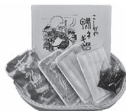
こしがや鴨ネギ鍋ギフトセット