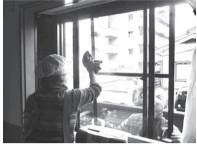
活動の一例(窓の網戸掃除)

時場▽12月7日(木)・平成30年1月12日(金)：中央市民会館5階▽12月11日(月)・30年1月15日(月)：産業雇用支援センター。いずれも午前9時30分～正午。固有償の就業により積極的な生活と社会参加による生きがいの充実を図る。市内在住の健康で働く意欲のある60歳以上の方。 囲